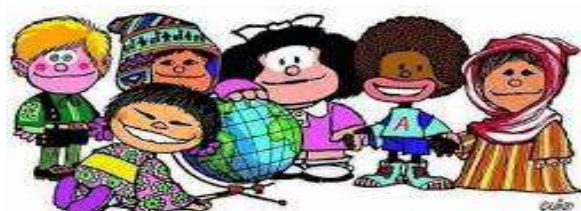
Imagem 3 Diversidade cultural

A diferença nos enriquece... ... O respeito nos une.