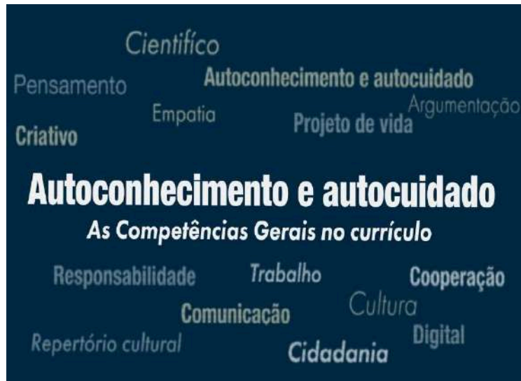
Nuvem de palavras

A partir da criação do Núcleo de Apoio à Saúde da Família (NASF) pelo Ministério da Saúde via a Portaria 154, de 24 de janeiro de 2008, a importância da atividade física/práticas corporais para a promoção da saúde e prevenção de doenças crônico-degenerativas foi reconhecida e o profissional da Educação Física passou a ter seu espaço na saúde.