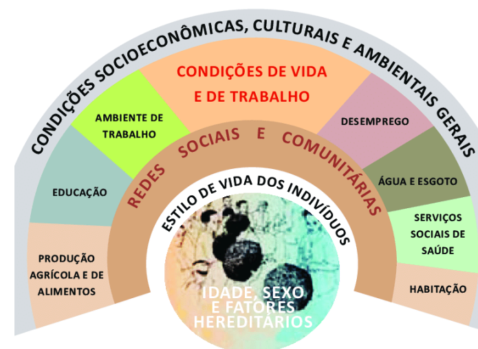
Figura 2 - Fatores Determinantes da condição de saúde proposto por Dahlgren e Whitehead (1991)