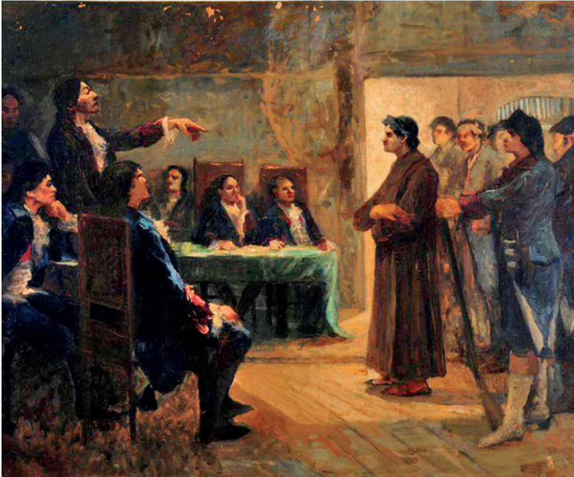
Estudo para Frei Caneca , de Antônio Parreiras (1918).

uma série de ataques por parte do parlamento, que condenou os julgamentos militares que se seguiram à Confederação do Equador. Com o passar do tempo, outras insatisfações foram somadas. Em 1831, a situação política do imperador estava insustentável, levando-o a abdicar do trono em favor de seu filho. Por ironia do destino, foi justamente o brigadeiro Francisco de Lima e Silva que, na noite do dia 6 de abril de 1831, ocupou com suas tropas o Campo da Aclamação, forçando Dom Pedro I a abdicar do trono, no dia seguinte, em 7 de abril. Por seu prestígio militar e político, Lima e Silva tornou-se membro da Regência Trina Provisória, ainda em abril daquele ano.