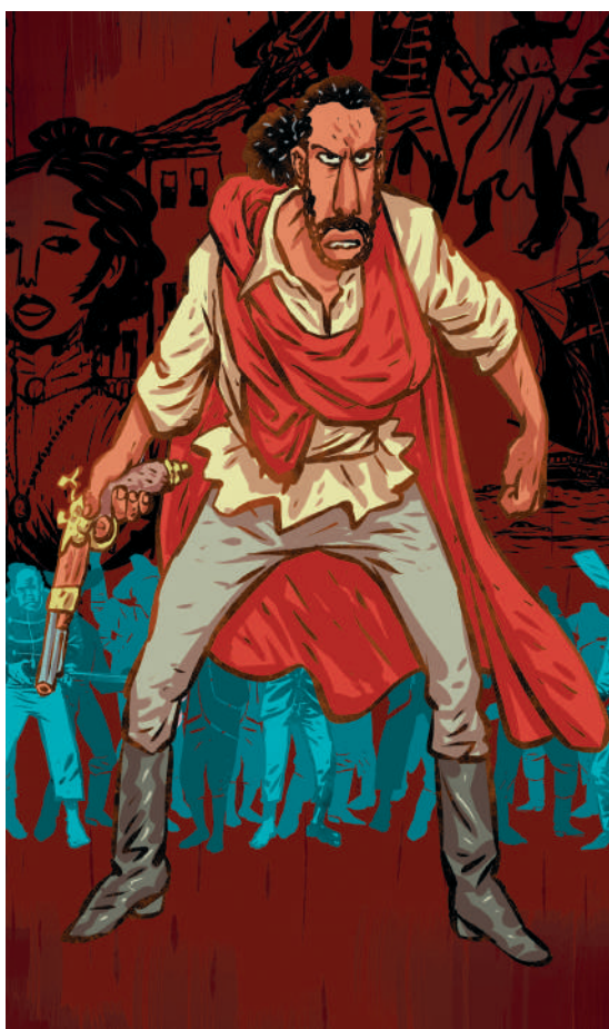
Ilustração da HQ Mundurucu na Confederação do Equador , da Cepe Editora

Foi um militar de cor parda, como se definiu, que teve participação ativa nos conflitos políticos e sociais de Pernambuco. Na época da Revolução de 1817, atuava como Alferes no posto de ajudante de ordens. Em 1821, quando os antigos rebeldes de 1817 formaram a Junta de Goiana, Mundurucu tomou o partido desses e marchou contra as tropas do general português Luís do Rego Barreto. Foi ferido em combate e recompensado com o grau de major. O sobrenome “Mundurucu” foi incorporado ao seu nome em 1823, seguindo um costume comum entre os re-