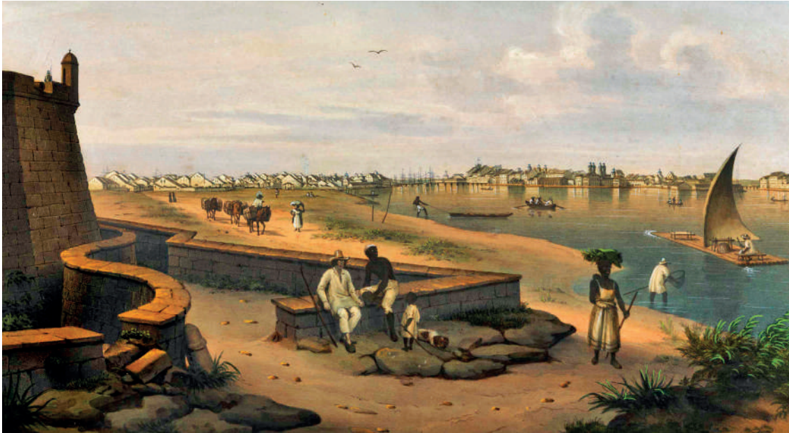
Vista da cidade do Recife tomada do Forte de São João Batista do Brum.