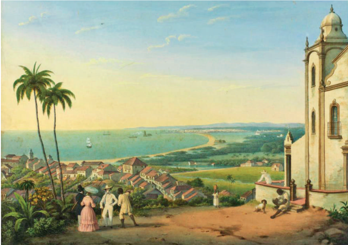
Vista da cidade do Recife e parte de Olinda tomada da Ladeira da Misericórdia.

novo centro do poder do Império Português. Em meados de dezembro de 1815, o Brasil foi elevado à condição de “Reino Unido a Portugal e Algarves”, o que fixava o Brasil no centro do Império Português.