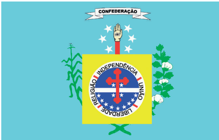
A bandeira da Confederação do Equador.

Contra o intervencionismo do poder central, em julho de 1824, parte das elites de Pernambuco, senhores de engenho, comerciantes ligados à exportação, traficantes de escravizados, magistrados e padres, com o apoio das camadas de homens livres pobres, formadas majoritariamente por pretos e pardos, libertos, militares de baixa patente, entre outros segmentos sociais, mobilizaram-se para uma revolta de grandes dimensões. Vale destacar que pretos e pardos, egressos da escravização, no Recife, foram empregados nas milícias durante as lutas pela independência do país.