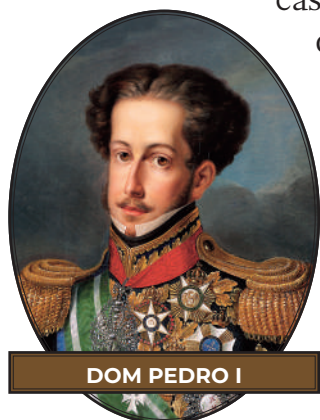
DOM PEDRO I

Ao nomear políticos a seu critério, desconsiderando o interesse das províncias, o imperador tocava em um ponto sensível: a autonomia provincial. As elites provinciais perdiam certa margem de liberdade de escolha de suas lideranças locais, algo que desde o período colonial já se figurava como uma prática política. A Constituição de 1824 instituiu uma monarquia liberal de fachada, parlamentarista e centralizadora. As ambições absolutistas de Pedro I tiveram ressonância nas províncias do Norte (como era denominado o Nordeste da época). Em crítica, Frei Caneca escreveu: “Uma constituição não é outra coisa que a ata do pacto social que fazem entre si os homens, quando se ajuntam e associam para viver em reunião ou sociedade”.