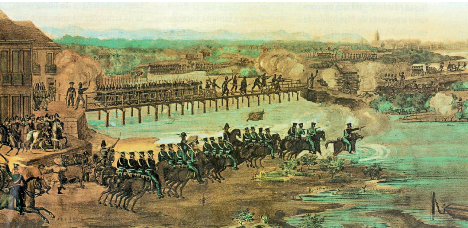
Exército do Império do Brasil ataca as forças confederadas no Recife, em 1824.