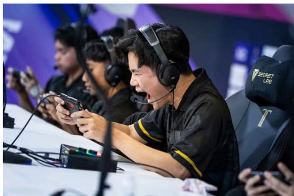
Esports World Cup 2024

O mercado de e-sports cresceu rapidamente de forma lucrativa e atraindo milhões de jogadores em todo o mundo. Contudo, apesar do crescimento, os e-sports ainda são uma questão polêmica, por não serem reconhecidos como um esporte legítimo, por estar atrelado ao sedentarismo. Apesar de apresentar alguns aspectos semelhantes ao treinamento dos esportes tradicionais, como: diversos tipos de treinamentos, exigência de rendimento, acompanhamento psicológico, comissão técnica, estudo de táticas dos jogadores ou de outros times (Villa, 2019).