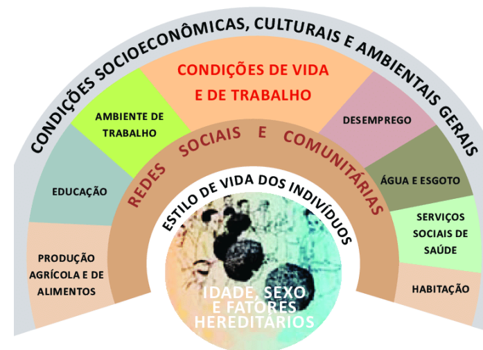
Figura 2 - Fatores Determinantes da condição de saúde proposto por Dahlgren e Whitehead (1991)