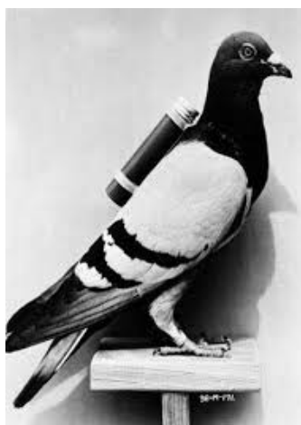
Imagem de pombo correio

A carta é um dos gêneros textuais mais antigos que existem. Ela é considerada a mãe do e-mail, o correio eletrônico. É um gênero textual dialógico, ou seja, visa estabelecer uma conversa entre indivíduos. Pode ser utilizado em muitos contextos e situações discursivas e pode ter variados graus de formalidade. Há vários tipos de carta, como carta comercial, carta oficial, carta aberta, carta do leitor, etc. Na estrutura básica de uma carta estão o remetente (aquele que escreve), o destinatário (aquele para quem o remetente escreve) e a mensagem (aquilo que se escreve). Apesar de ainda ser possível escrever e enviar cartas físicas, a modalidade digital de correio é a forma mais comum de envio de informação atualmente. Você sabia que pombos eram treinados, na Idade Média, para levar correspondências de um reino a outro? Como as coisas mudaram, não é?